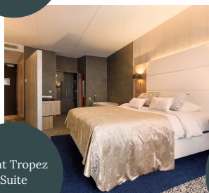
Saint Tropez Suite